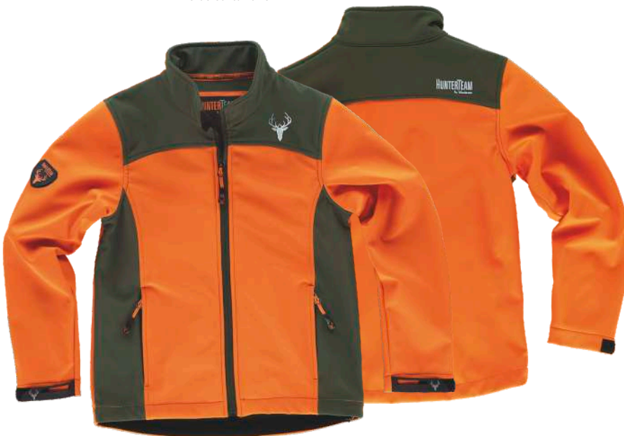
naranja a.v./verde caza

Tejido: 96% Poliéster 4% Elastano (300 g/m2)